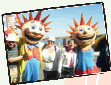
Fun day at Luna Park

TNC Inc. vodi dva rekreacijska programa; jedan program je lociran u Blacktownu, a drugi program je u Mt. Druitt.